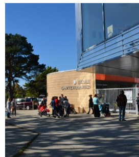
École - ZAC du Courtil Brécard