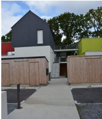
Boîtes aux lettres, local poubelle et celliers intégrés - ZAC Clos du Moulin