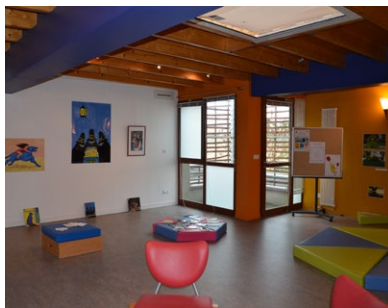
Médiathèque - La Chapelle des Marais

> De même, au Courtil Brécard et à la ZAC centre-bourg de Saint-André des Eaux, la maîtrise d'ouvrage a été déléguée à la SONADEV (société d'économie mixte) pour le compte de la ville dans le premier cas et pour le compte de la CARENE dans le second cas.