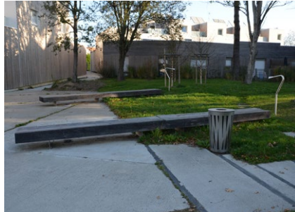
Mobilier urbain sobre et généreux - ZAC du Courtil Brécard