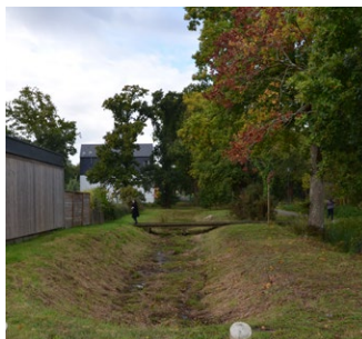
Noue paysagée - ZAC Clos du Moulin