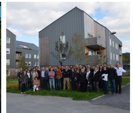
Saint-André des Eaux

CAUE du Finistère 32, boulevard DUPLEX CS 29029 29196 QUIMPER Cedex