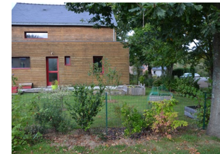
Grillage en retrait de la limite de parcelle avec haie d'espèces variées en quinconce - ZAC Clos du Moulin