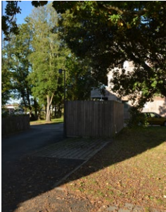
Local poubelles et stationnements prévus - ZAC du Courtil Brécard