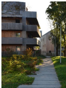
Chemin piéton paysagé - ZAC du Courtil Brécard