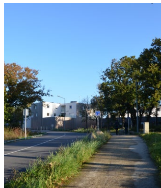
Cheminement séparé de la voie routante par une bande végétalisée - ZAC du Courtil Brécard