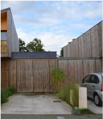
Garages et patios intégrés - ZAC Clos du Moulin