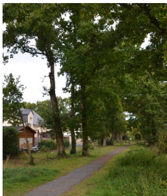
Structure paysagère définissant le réseau de cheminement doux - ZAC Clos du Moulin