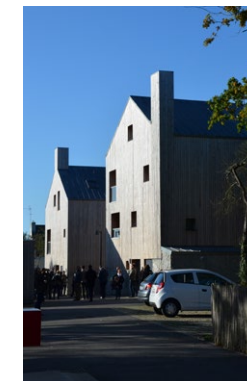
Sobriété des aménagements et des constructions - ZAC du Courtil Brécard