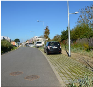
Rue de desserte principale - ZAC du Courtil Brécard