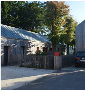
Seuils à niveau, ganivelles, coffrets élec. intégrés, boîtes aux lettres homogènes - ZAC du Courtil Brécard