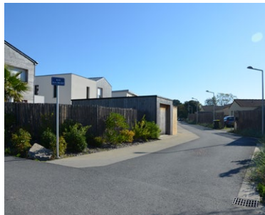
Traitement homogène des clôtures et des garages, sobriété dans l'aménagement de la voirie - ZAC du Courtil Brécard