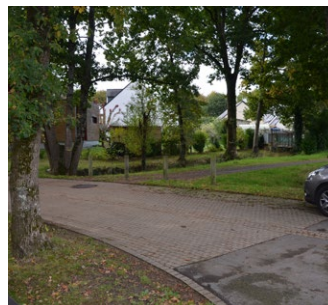
Zone de croisements piétons/véhicules signalée par un changement de revêtement - ZAC Clos du Moulin