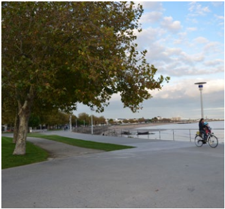
Aménagement du front de mer - Saint-Nazaire