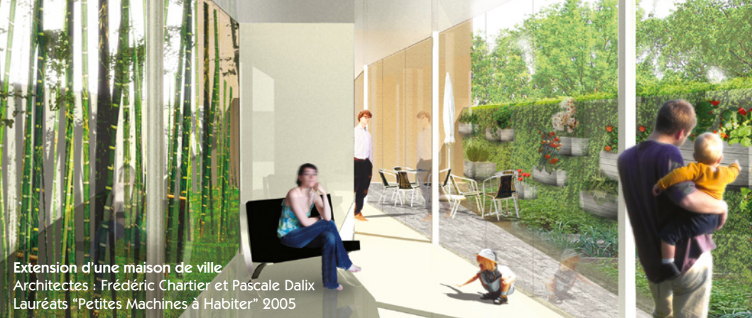
Extension d'une maison de ville Architectes : Frédéric Chartier et Pascale Dalix Lauréats "Petites Machines à Habiter" 2005